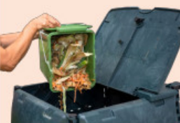
Composteur et/ou animaux